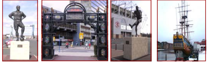
George Hardwick, M'brough Arch, Wilfred Mannion, HMS Endeavour.